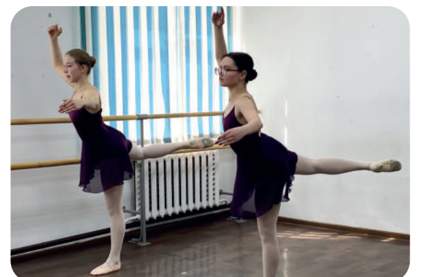
По материалам, предоставленным РДШИ