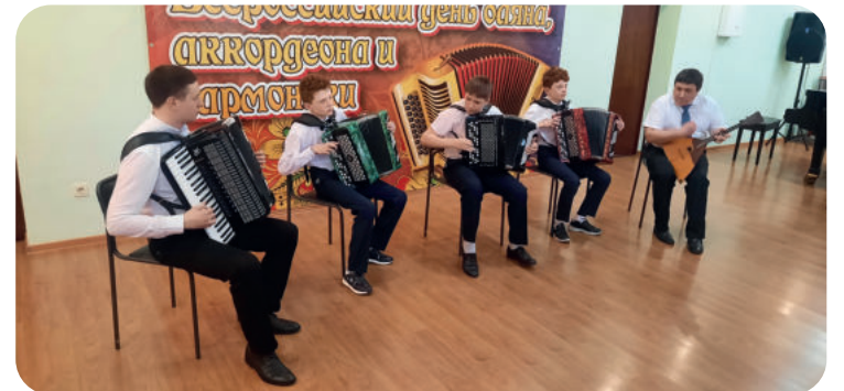
Украшением концертов всегда были наши инструменталисты – пианисты, гитаристы, баянисты, без которых не обходится ни одно мероприятие в школе искусств.