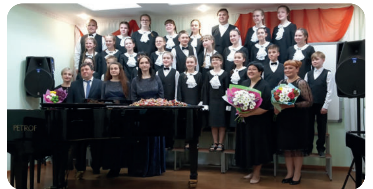
Хор «Доминанта» – гордость нашей школы. Лауреаты, дипломанты международных, всероссийских, региональных, областных, муниципальных конкурсов и фестивалей.

доскоп», основанного в 1994 году. Коллектив ведет активную концертную и конкурсную деятельность, выступая на различных концертных площадках Ирбитского МО для разных категорий населения, участвует в районных праздничных мероприятиях. В 2010 году коллективу было присвоено почетное звание «Образцовый коллектив любительского художественного творчества». В 2021 году коллектив успешно подтвердил высокое звание. Сегодня коллектив является Лауреатом районных, областных, Всероссийских и Международных фестивалей и конкурсов.