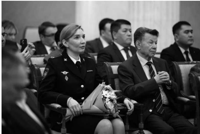
Губернатор Свердловской области Евгений Куйвашев в преддверии Дня Конституции поздравил уральцев с 30-летием главного закона Российской Федерации.

Тридцать лет назад была принята Конституция Российской Федерации. Это событие стало поворотным в судьбе государства. Основным законом страны создан необходимые условия для развития сильной и независимой России, заложил основы для нынешних социально-экономических успехов и достижений. Свердловская область и уральцы всегда не словом, а делом доказывали и доказывают верность интересам страны, своим добросовестным трудом, интеллектом и энергией вносят весомый вклад в достижение общих побед страны. Сегодня перед нами стоят новые ответственные и масштабные задачи, которые мы можем решить только вместе. Уверен в нашем единстве, настроен на эффективную, качественную работу на благо Свердловской